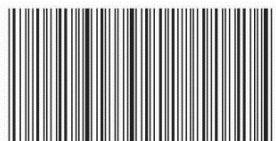
Izgled bar-koda za vozila